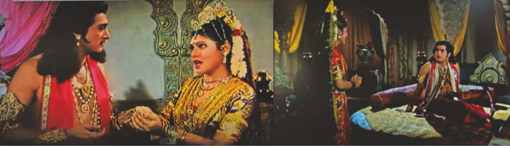
स्त्रीचा आपल्या पतीशी संबंध स्त्रीचा आपल्या मुलाशी संबंध

(या चित्रांचा संदर्भ : श्री रामानंद सागर यांच्या दूरदर्शन धारावाहिक 'श्रीकृष्ण' येथून घेतलेले आहेत.)