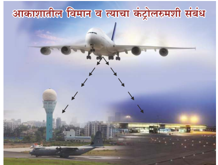
(संदर्भ पृष्ठ ४३ पाहावे)

उदाहरणार्थ : बाजूच्या चित्रामध्ये दाखविल्याप्रमाणे आकाशात दिमाखात उडणारे विमान आपले उडण्याचे कर्तव्यकर्म करत असताना सतत कंट्रोल रूमशी संपर्क ठेवत असते. कर्तव्यकर्म करत असताना