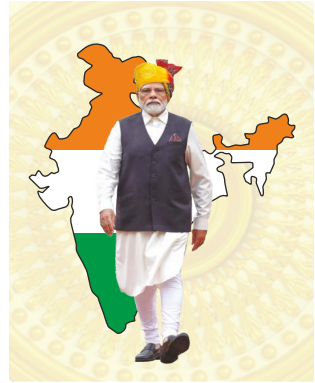
(संदर्भ पृष्ठ ५० पाहावे)