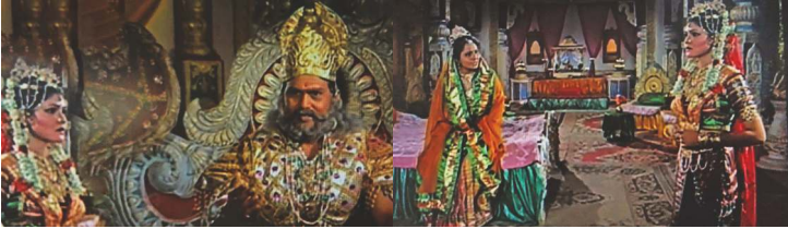
स्त्रीचा आपल्या वडीलाशी संबंध स्त्रीचा आपल्या आईशी संबंध