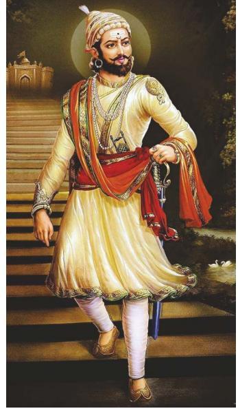
(संदर्भ पृष्ठ ४९ पाहावे)

देशाचे पंतप्रधान या नात्याने राष्ट्राचा सर्वांगीण विकास करणे हा त्यांचा स्वधर्म आहे. त्यानुसार ते त्यांची सर्व कर्तव्य कर्मे पूर्ण श्रद्धा, विश्वास व