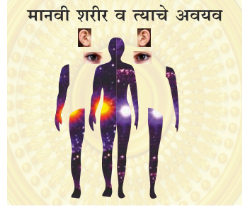
(संदर्भ पृष्ठ ४३ पाहावे)

उदाहरणार्थ बाजूच्या चित्रात दाखविल्याप्रमाणे आपल्या शरीरातील सर्व अवयव आपल्या कर्मांद्वारे सतत आपल्या शरीराशी संपर्कात राहतात. आपल्या इष्ट देवतेशी आपल्या कर्तव्यकर्मांद्वारे असा संपर्क कर्मयोग दर्शवितो.