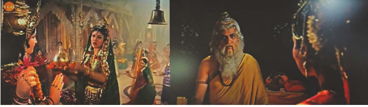
स्त्रीचा आपल्या इष्ट (आराध्य) देवतेशी संबंध स्त्रीचा आपल्या सद्गुरूशी संबंध

एका अगदी साध्या उदाहरणातून हे पाहू : खालील चित्रात दर्शविल्याप्रमाणे एक स्त्री आपल्या आई-वडिलांची मुलगी, आपल्या नवऱ्याची पत्नी, आपल्या बाळाची आई, आपल्या इष्ट देवतेची भक्त व आपल्या सद्गुरूची शिष्य असे विविध रोल एकाच शरीराद्वारे करत असते व ते सर्व रोल पूर्णपणे भिन्न दिसतात, त्या रोलमध्ये भिन्नता पण असते. पण ती स्त्री एकच असते. त्याचप्रमाणे परमात्मा (ईश्वर) प्रत्येक व्यक्तीला त्याच्या इष्ट देवतेच्या तसेच इतरांच्या इष्ट देवतेच्या स्वरूपात अनुभूती देत असतात.